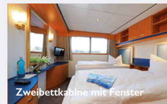
Zweibettkabine mit Fenster