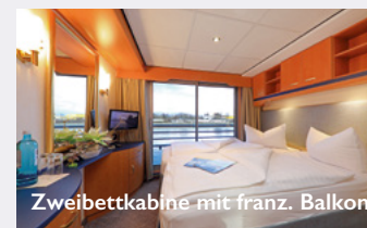
Zweibettkabine mit franz. Balkon

Reisebedingungen: Es gelten die AGB des Veranstalters.